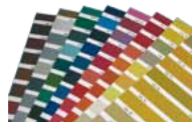
Teintes sur demande