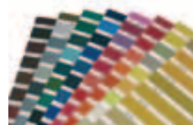
Teintes sur demande